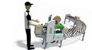
ゴールドテープ + 伸縮ジャバラコンベア