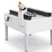
GOLDTAPE50B ゴールドテープ50B ◀ 半自動底貼封かん機