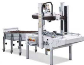
GOLDTAPE34R ゴールドテープ34R ▲ 半自動ランダム封かん機