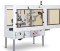
GOLDTAPE56F ゴールドテープ56F ▲ 自動封かん機