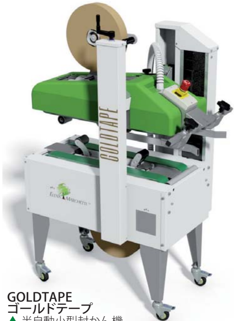
GOLDTAPE ゴールドテープ ▲ 半自動小型封かん機 日本最小クラス封かん機