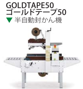
GOLDTAPPE50 ゴールドテープ50 ▼ 半自動封かん機