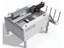
GOLDFLEX056 ゴールドフレックス056 ▶ 半自動製函機