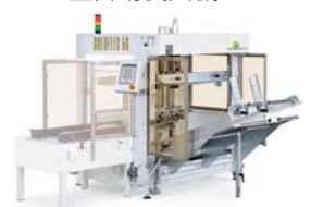
GOLDFLEX56 ゴールドフレックス56 ▼ 全自動製函機