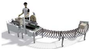
ゴールドフレックス056 + ゴールドテープ50 + 伸縮ジャバラコンベア