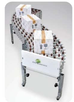
ゴールドフレックス056仕様 (半自動製函機)