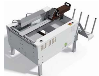
▲ ゴールドフレックス056 半自動製函機 GOLDFLEX056