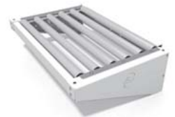
▲ フリーローラーコンベア PRF04 長さ: 400 mm 幅: 510 mm