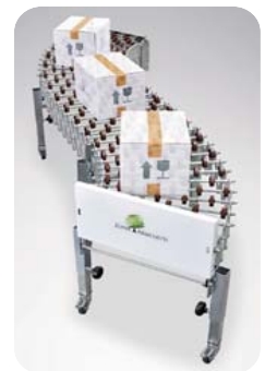
▲ 伸縮ジャバラコンベア PRE50/3

長さ: 1350 ~ 4450 mm 幅: 622 mm 標準搬送レベル: 最小450 mm ~ 最大750 mm ケース重量: 50 Kg (最大拡張時、1メートル当たり)