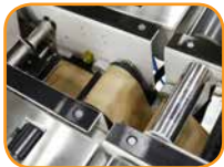
テープセットアップが簡単