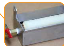
特許ローラー方式で水付き抜群