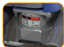
パワフルな1/3HPツインモーター