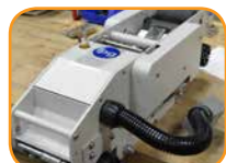
テープユニット取り出しが簡単