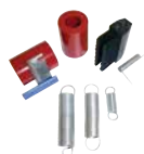
テープユニットスペアパーツキット