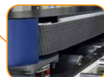
高品質サイドベルト