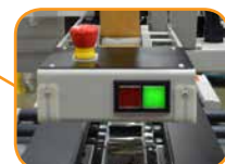
適切なケース間距離をランプで表示