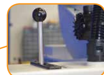
スライド&ロック機能で高さ調整が簡単