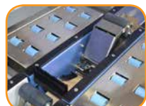
コーナー貼りがスムーズ