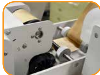
テープたるみ防止機能